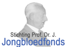
Stichting Prof. Dr. J. Jongbloedfonds